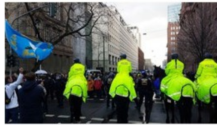
Die Reiterstaffel der Polizei begleitet die Demonstranten.

Erst mit Hilfe massiver Verstärkung aus weiteren Städten konnte die Polizei anschließend rund 200 Demonstranten in Nähe der Königsallee in der Düsseldorfer Innenstadt festsetzen und deren Personalien aufnehmen. Zunächst war von Festnahmen die Rede. Das Ordnungsamt ahndete zahlreiche Verstöße gegen die Corona-Regeln.