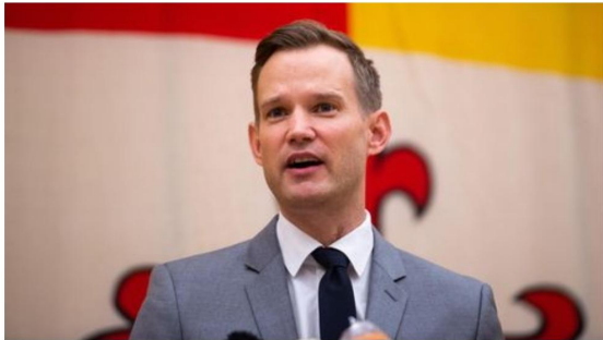
Virologe Hendrik Streeck im März auf einer Pressekonferenz zum Coronavirus